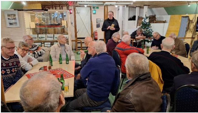
Het technische verhaal tijdens de Stapelloop.